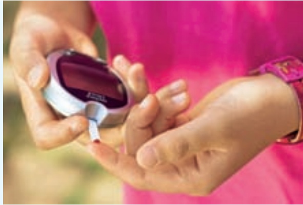
Schnell und einfach: Der Blutzuckertest

Auch während des Unterrichts kann es deshalb nötig sein, den Blutzucker zu kontrollieren. Die Messung geht schnell und ohne großen Aufwand und