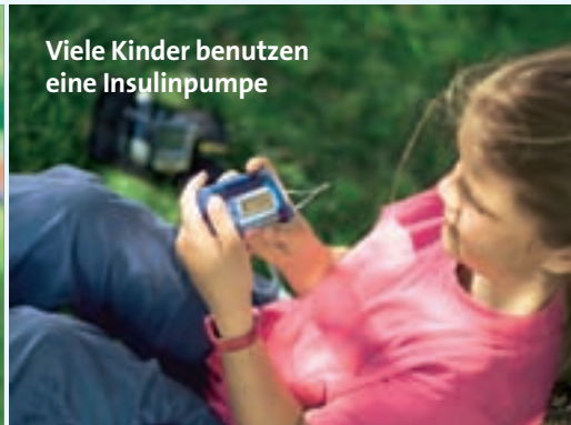
Viele Kinder benutzen eine Insulinpumpe